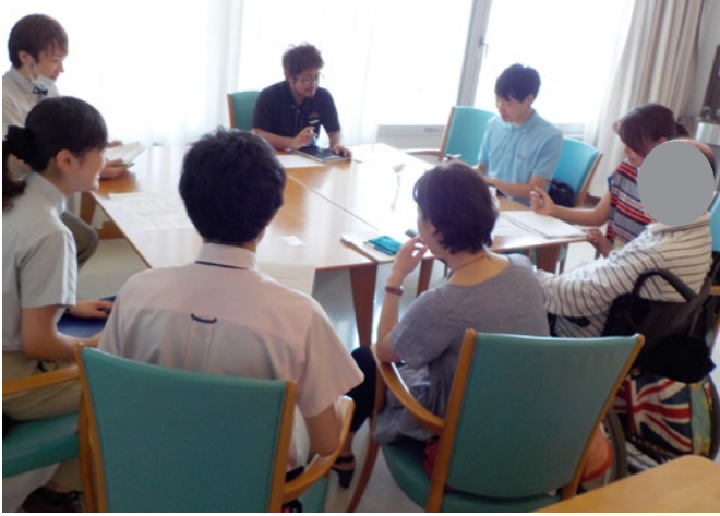
<退院前ケアカンファレンス>